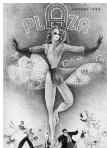
Von den Nazis arisiert: das Berliner Varieté »Plaza«